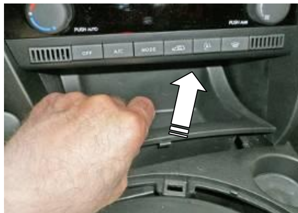
Снимите накладку консоли