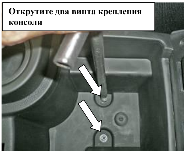
Открутите два винта крепления консоли