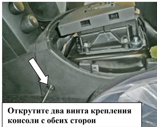
Открутите два винта крепления консоли с обеих сторон