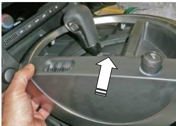
Снимите верхнюю накладку консоли