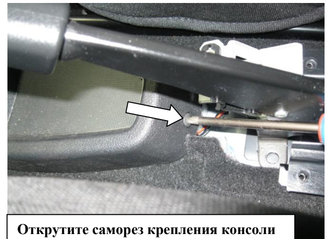
Открутите саморез крепления консоли