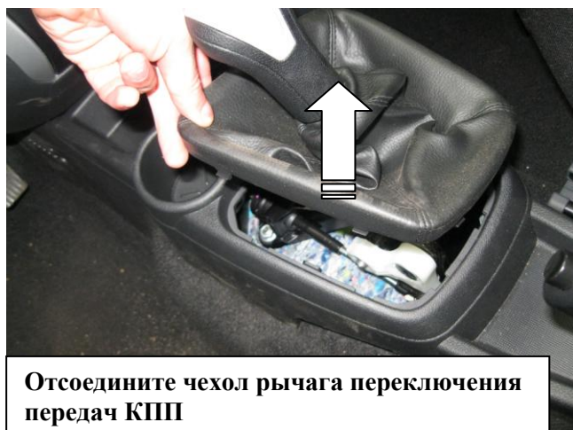
Отсоедините чехол рычага переключения передач КПП