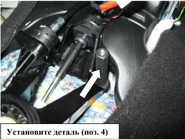
Установите деталь (поз. 4)