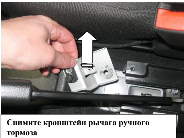
Снимите кронштейн рычага ручного тормоза