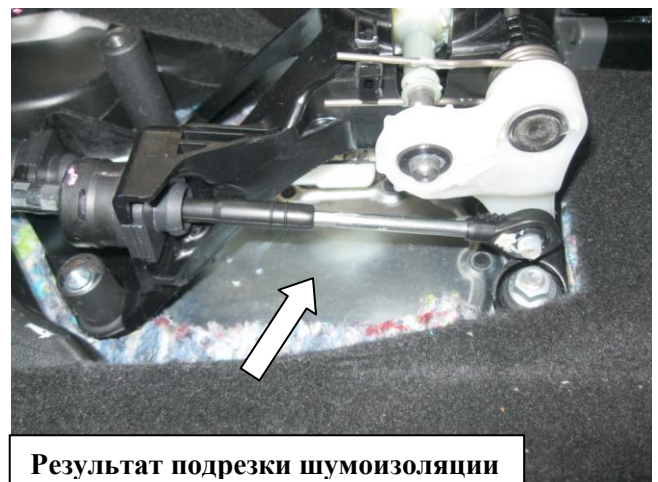
Результат подрезки шумоизоляции