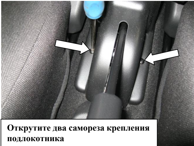
Открутите два самореза крепления подлокотника