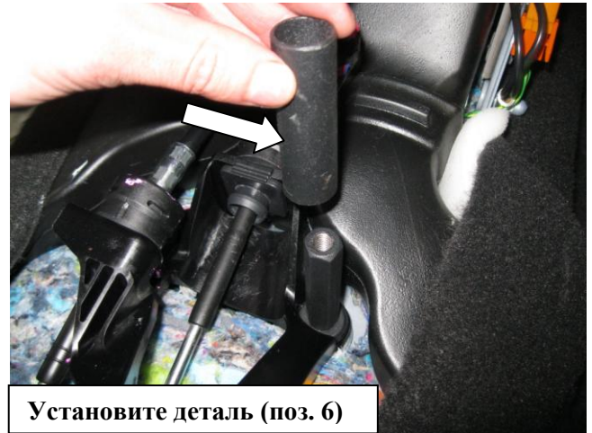
Установите деталь (поз. 6)