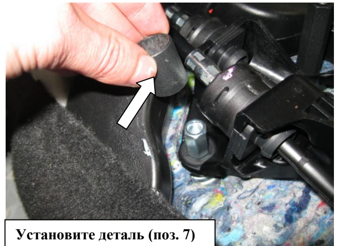
Установите деталь (поз. 7)