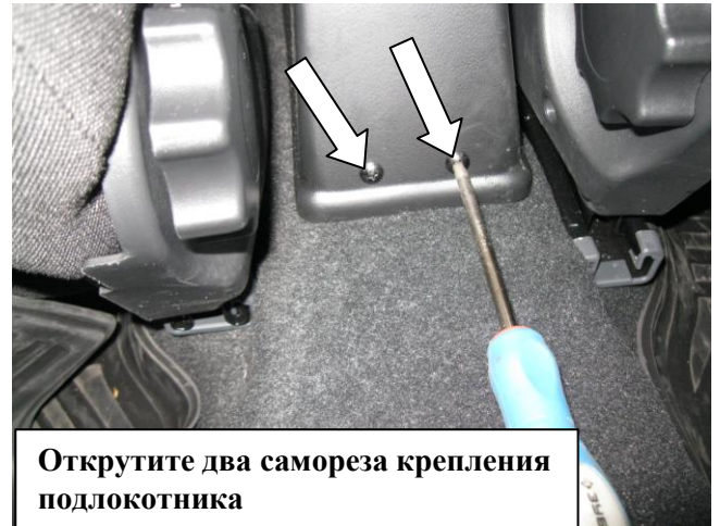
Открутите два самореза крепления подлокотника