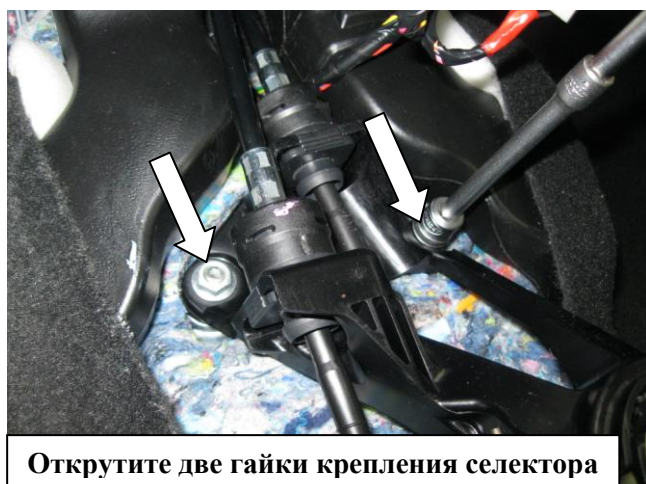
Открутите две гайки крепления селектора