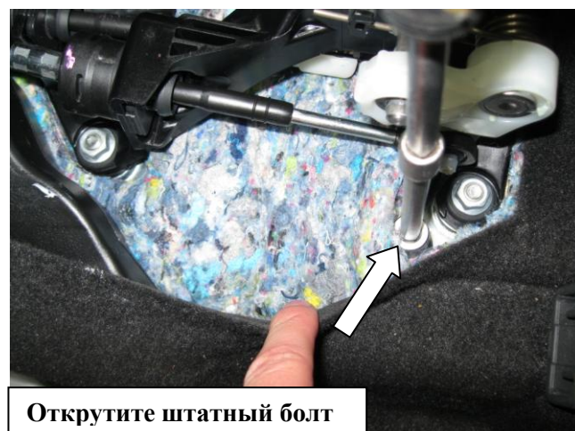
Открутите штатный болт