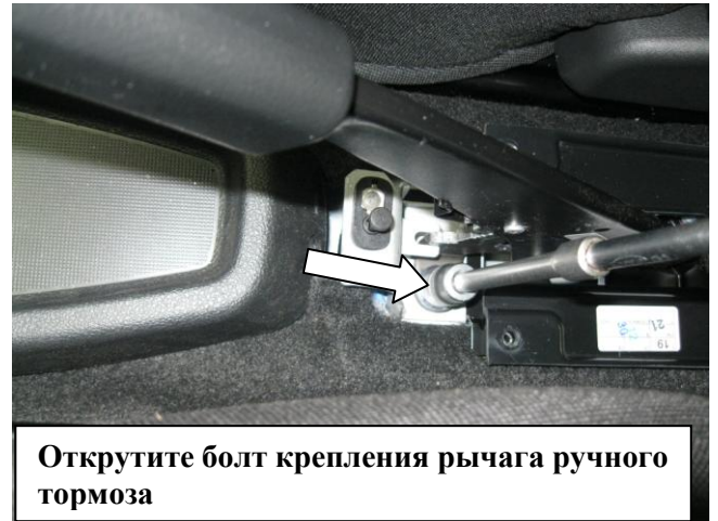
Открутите болт крепления рычага ручного тормоза