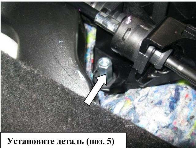
Установите деталь (поз. 5)