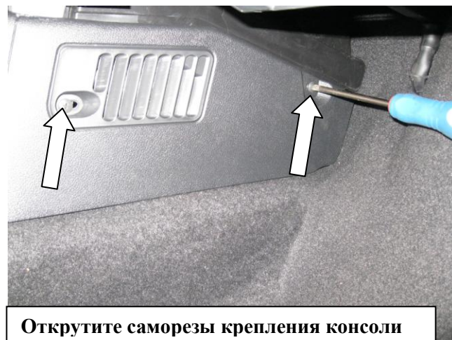
Открутите саморезы крепления консоли