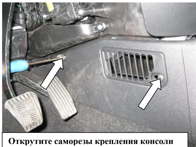
Открутите саморезы крепления консоли