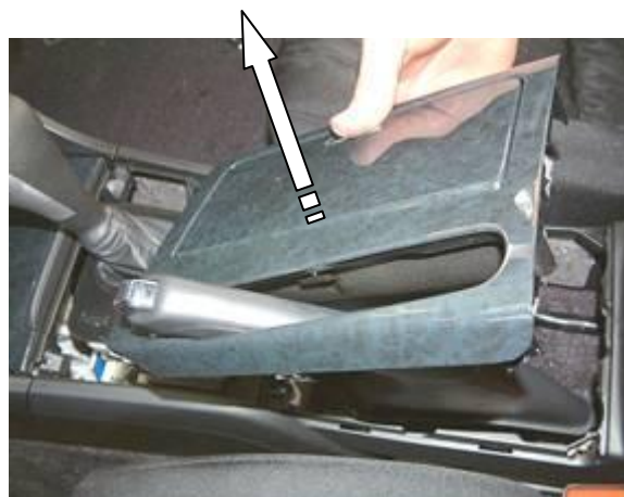
Снять верхнюю заднюю крышку