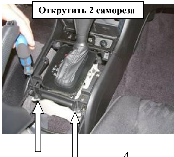
Открутить 2 самореза