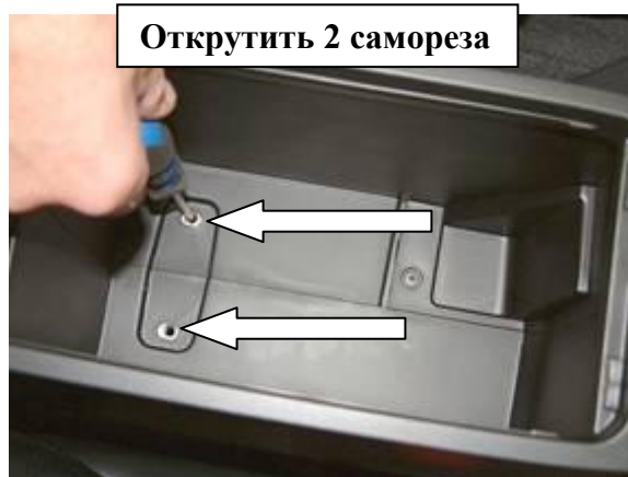
Открутить 2 самореза