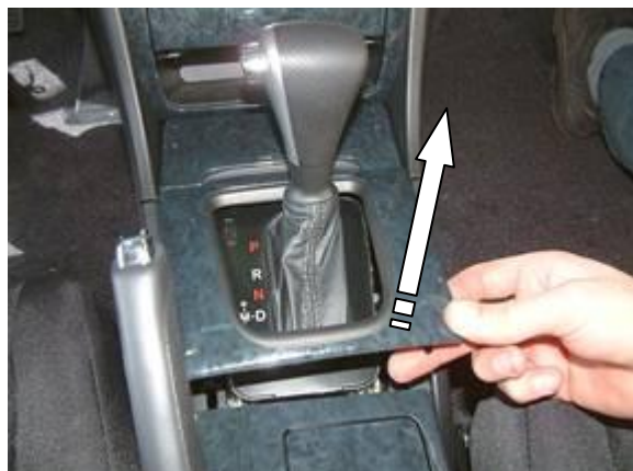
Снять верхнюю переднюю крышку