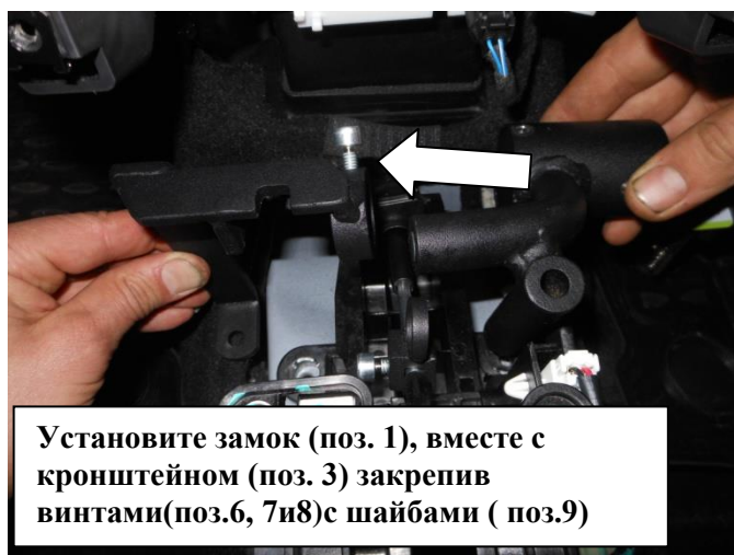
Установите замок (поз. 1), вместе с кронштейном (поз. 3) закрепив винтами(поз.6, 7и8)с шайбами ( поз.9)