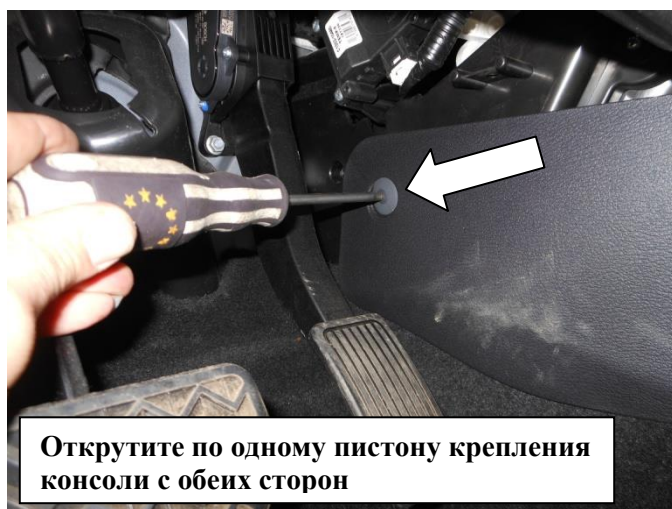
Открутите по одному pistону крепления консоли с обеих сторон