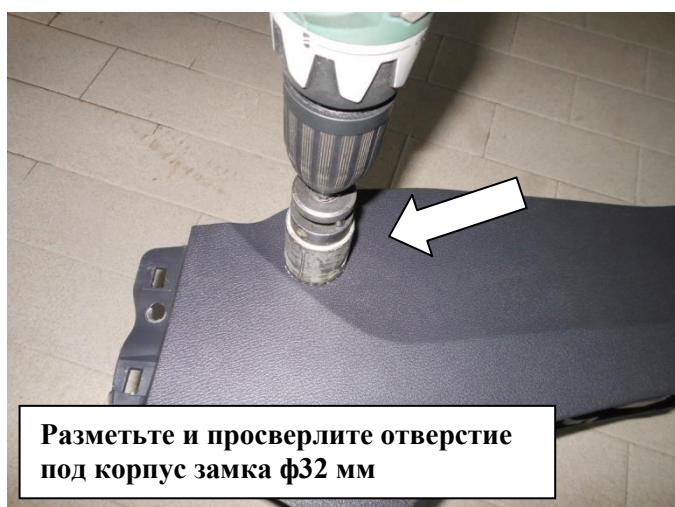
Разметьте и просверлите отверстие под корпус замка ф32 мм