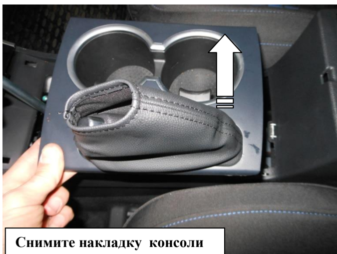
Снимите накладку консоли