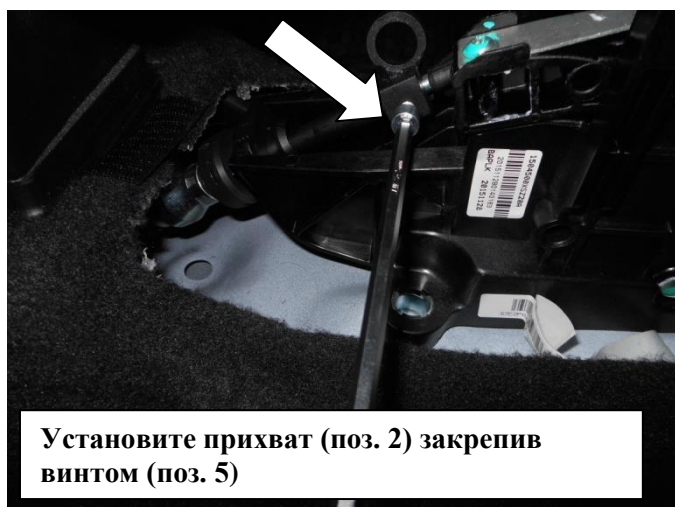
Установите прихват (поз. 2) закрепив винтом (поз. 5)