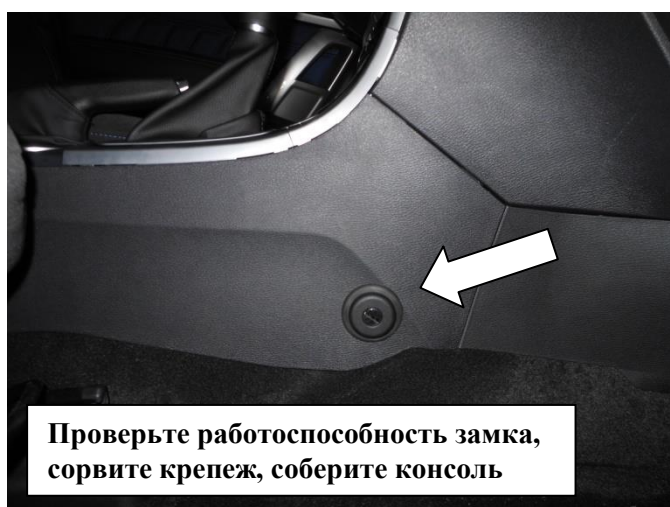
Проверьте работоспособность замка, сорвите крепеж, соберите консоль