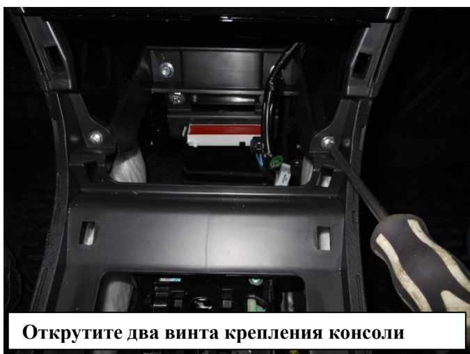
Открутите два винта крепления консоли