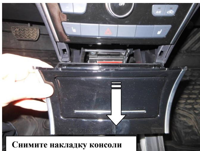
Снимите накладку консоли