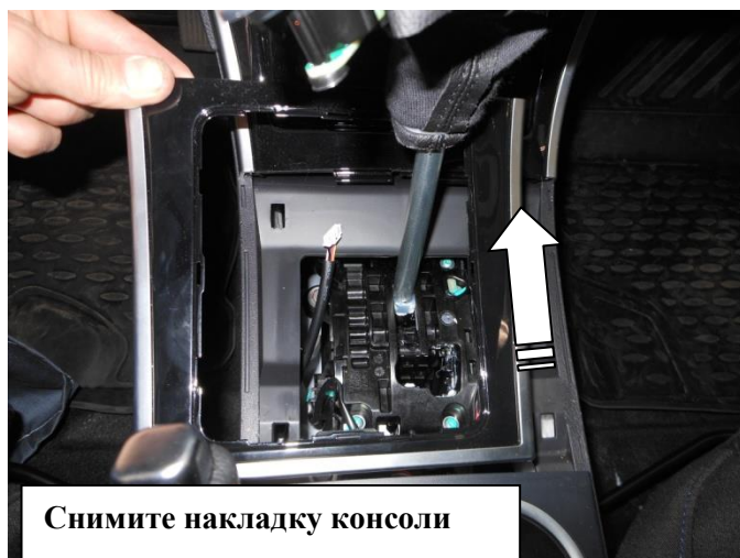
Снимите накладку консоли