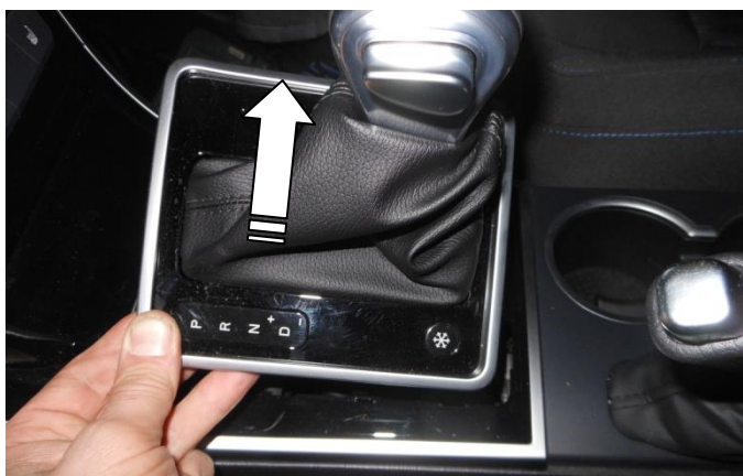
Снимите накладку кожуха рычага КПП