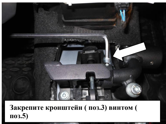
Закрепите кронштейн ( поз.3) винтом ( поз.5)