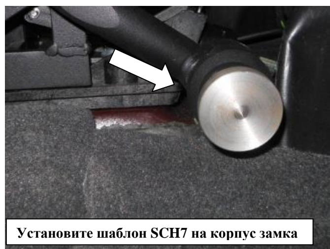
Установите шаблон SCH7 на корпус замка